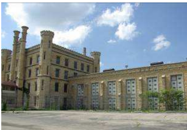
La prison de Joliette (« Prison break » saison 1)