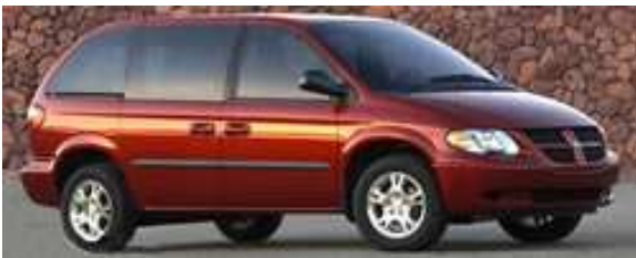
Van 5/7 places Dodge Caravan