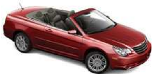
Cabriolet 4 places Chrysler Sebring