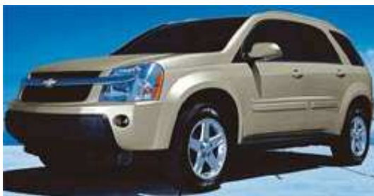
4X4 (SUV) 5 places Chevy Equinoxe